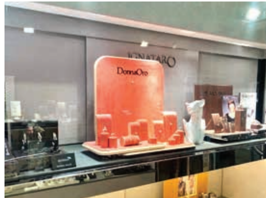
Pignataro Gioielli Via Giovanni Bovio, 75 Andria (BT) Viale Francesco Crispi, 43 Andria (BT)