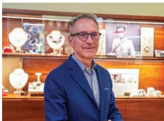
Rodighiero Gioielli dal 1950 Via Italia, 66 - Biella