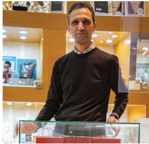
AURUM Viale Paolo Orlando, 34/36 - Roma