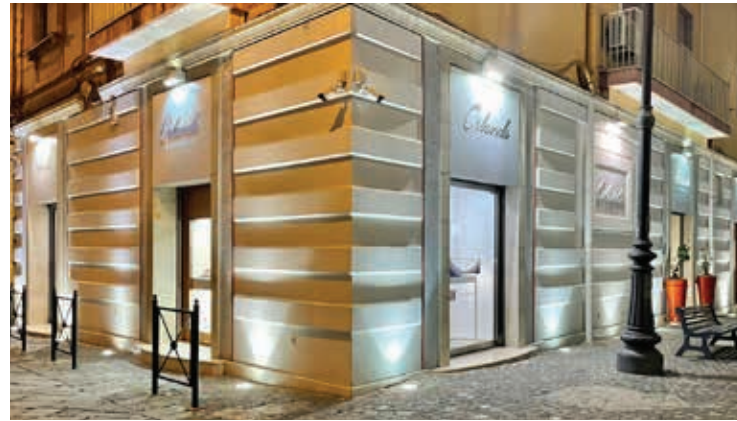
Gioielleria Orlando Via Zurlo, 69, 84012 Angri (SA)