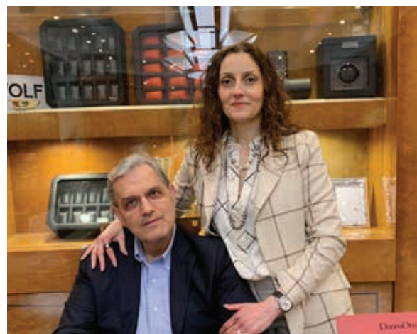
Gioielleria Ranalletta Via Trieste, 10 Avezzano (AQ)