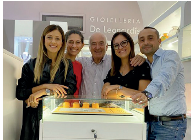
Gioielleria De Leonardis Via San Francesco, 21 Castellaneta (TA)