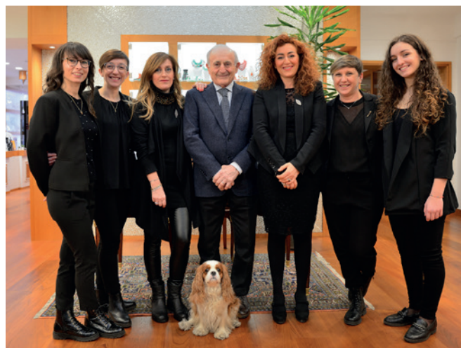
Gioielleria Giorgio Szulin Largo dei Pecile, 29 Udine