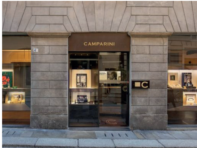
Gioielleria Camparini Via Emilia San Pietro, 2/E Reggio Emilia