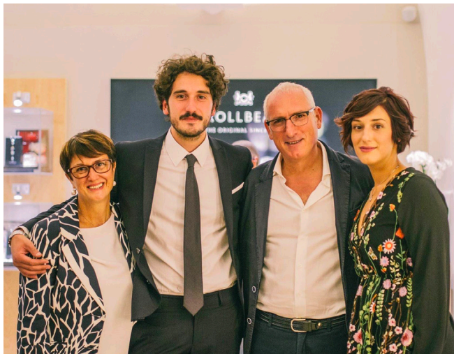
D'Elia Gioielli Corso Vittorio Emanuele, 52 Terlizzi (BA)