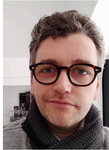
L'Argento e Mioro Corso Umberto I° Termoli (CB)