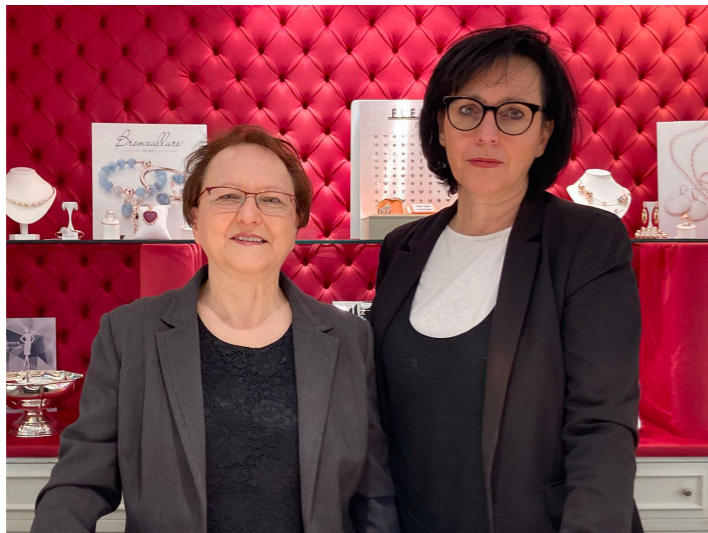
Gioielleria De Sanctis Via Firenze, 202/204 Pescara